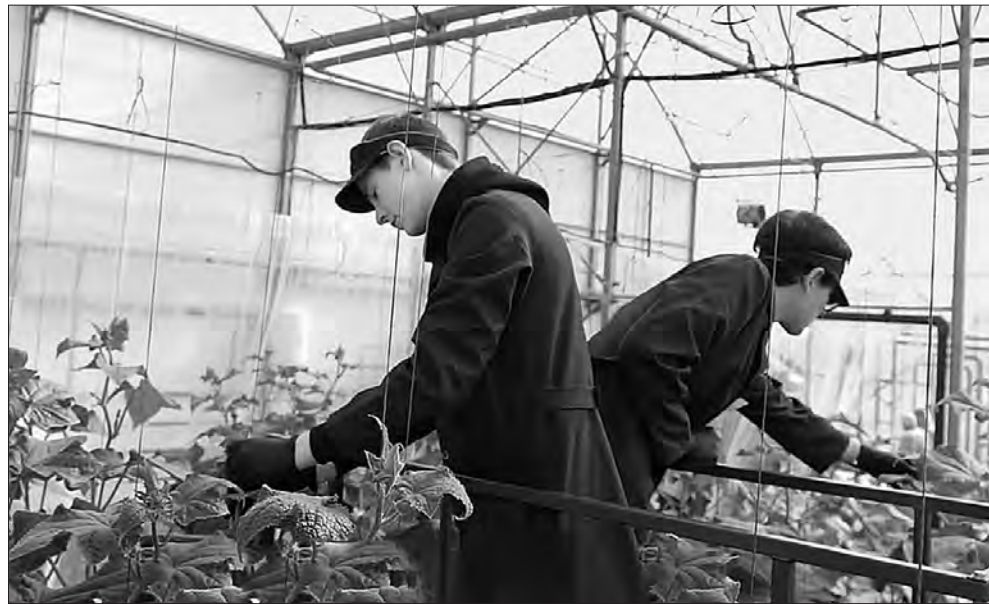
За всім процесом від посадки насіння до збирання врожаю стежать учні та майстри навчального закладу.

Вирощування у спеціальних коробах і матах без ґрунту, дотримання відповідної системи поливу та підживлення, точний температурний і світловий режим — все це не може не позначитись на вартості товару. Але керівники деяких хмельницьких шкіл, соціальних закладів, котрі вже замовили і отримали огірки зі студентської теплиці, зазначають, що вони обходяться дешевше, ніж коли купувати у традиційних поставальників.