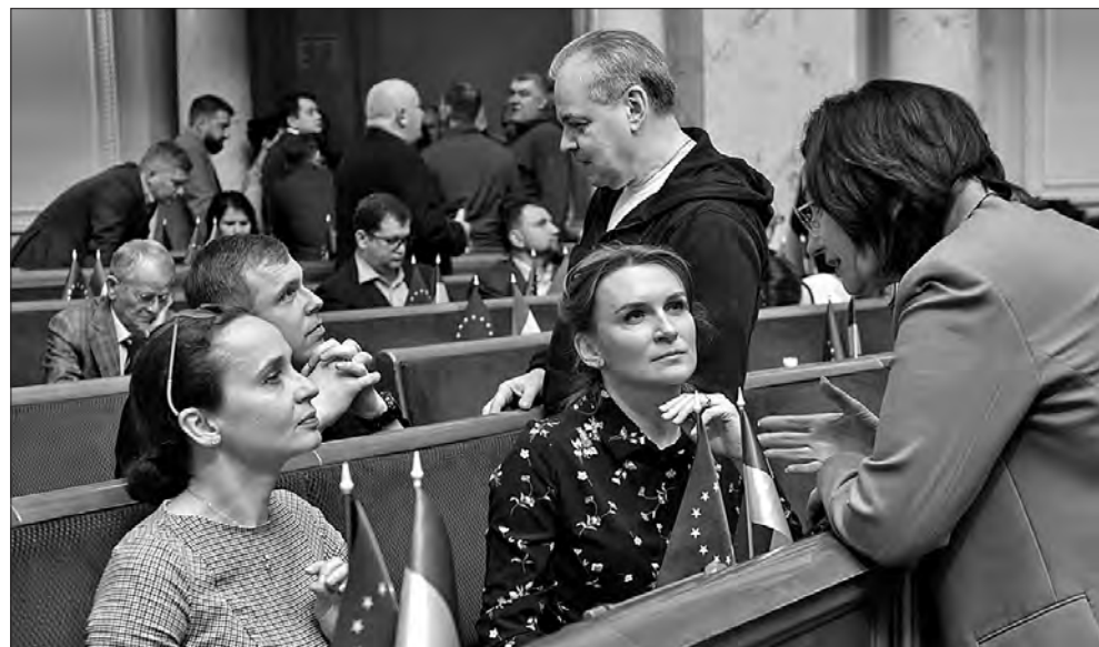
Під час засідання.

Водночас законопроект «Про внесення змін до Закону України «Про Державний бюджет України на 2023 рік» щодо ви-