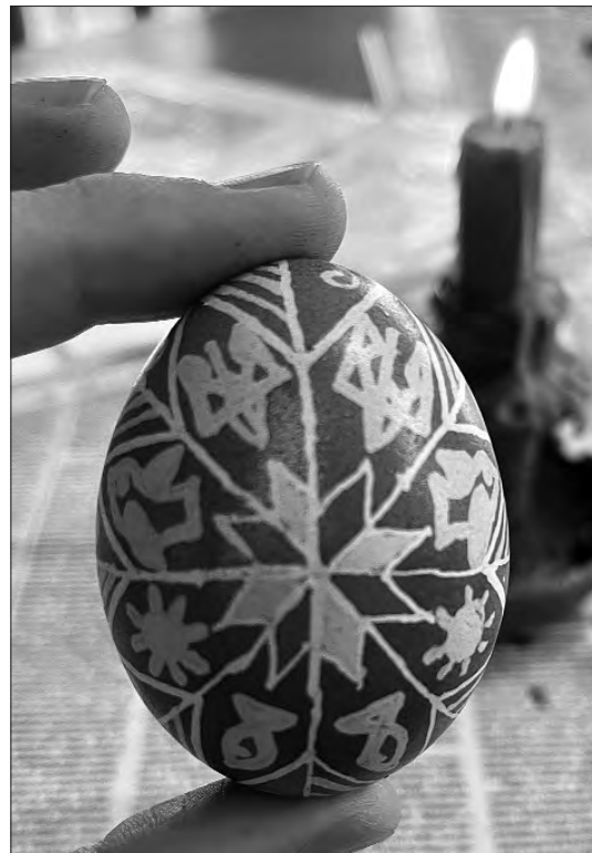
Фото зі сторінки Тобіаса Тибберга у Твіттері.

«Це моя перша власноруч зроблена українська писанка, вкрита тризубами та язичницькими добрими побажаннями Перемоги», — написав посол.